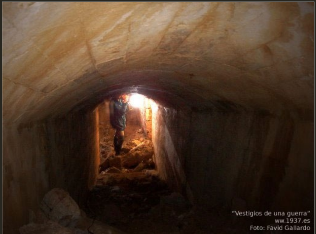
"Vestigios de una guerra" ww.1937.es

Junto a los supervivientes de la contienda el gran protagonista de la serie documental es el extraordinario patrimonio de la guerra que todavía se conserva en Asturias. Estructuras de fortificación levantadas en lugares estratégicos que el paso del tiempo, pero también la desidia, han relegado al olvido. Muchas, entre sebes, tomadas por la maleza, son irreconocibles a primera vista; otras en cambio mantienen su figura imponente en el paisaje de nuestra tierra. Todas forman parte de un legado histórico y cultural que como sociedad avanzada debemos preservar y entregar en las mejores condiciones a las próximas generaciones que en ellas encontrarán un recurso de investigación de indudable valor y por supuesto un atractivo cultural e incluso pedagógico. Testimonios materiales de acontecimientos que forman parte substancial de la Historia contemporánea de Asturias.